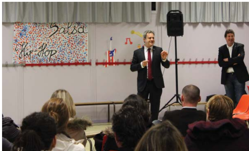
Parfois vifs, les échanges se sont déroulés dans une ambiance conviviale la plupart du temps.

La nouvelle organisation du temps de l'enfant en maternelle et élémentaire réparti sur 9 demi-journées au lieu de 8 les 24 heures d'enseignement hebdomadaires et les activités pédagogiques complémentaires (APC) assurées par les enseignants. Ainsi, avec un temps d'enseignement le mercredi matin, les autres journées seront allégées d'autant.