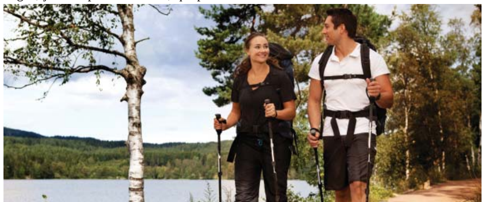
La marche nordique est désormais proposée par Goële Rando.

L'annuaire des associations sportives est disponible sur le site de la ville.