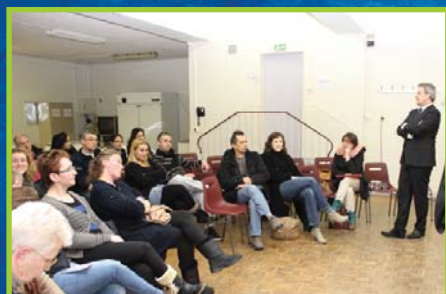
Rythmes scolaires p.3