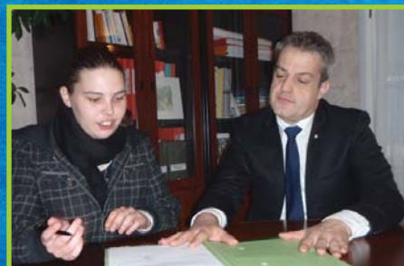
Emplois d'avenir p.5