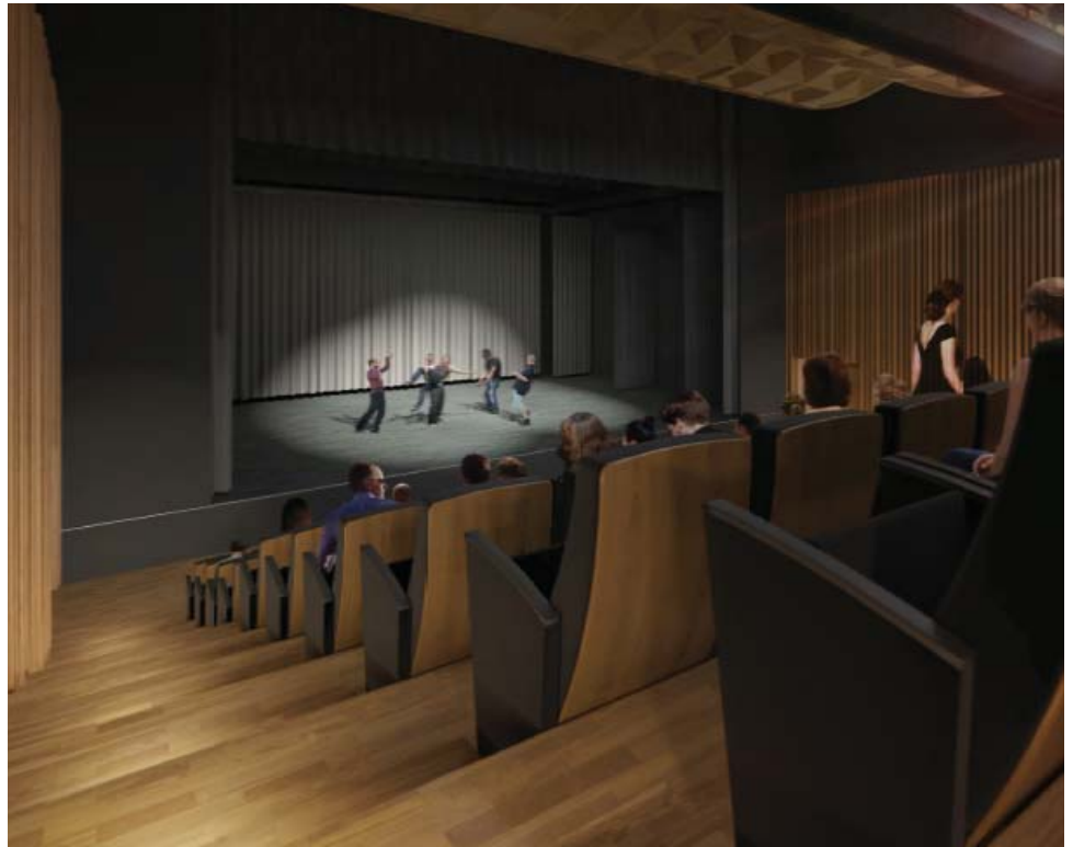
La future salle de spectacles de Dammartin disposera de gradins rétractables, permettant l'accès à un public plus nombreux.

En effet, l'ensemble de notre canton est