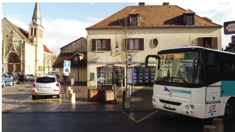
De nombreuses lignes de bus desservent Dammartin.

Dès 2010 la ville a lancé une réflexion, en partenariat avec les CIF, sur les besoins de desserte intra-muros (faciliter les déplacements