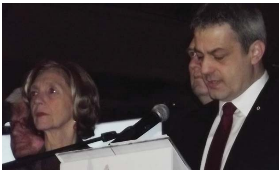
Le maire était accompagné de Nicole Bricq, ministre du commerce extérieur, sur la scène du gymnase du centre.

Le maire a présenté ses vœux à la population le jeudi 24 janvier, au gymnase du centre, en présence de Nicole Bricq, ministre du commerce extérieur. Retour sur les thèmes nationaux, bilan de l'année écoulée, présentation des projets en cours et intercommunalité ont été les éléments de son discours.