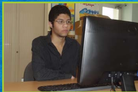
Découvrez l'espace numérique du Centre social et culturel en page 6.