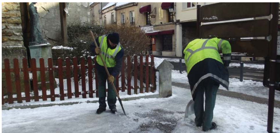
Les agents municipaux ont eu fort à faire, notamment le mardi 22 janvier, où il a neigé pendant 14 heures consécutives.

Les agents municipaux ont fait face à un épisode neigeux exceptionnel au cours du mois de janvier. Sur le terrain dès 3h30 du matin suite à l'alerte de Météo France le 18 janvier, et totalisant près de 450h de travail de jour et 154h de travail d'astreinte la nuit, ils ont été le rouage principal du plan de déneigement municipal, auquel participe également le département. Pour mieux gérer la situation, la mairie a d'ailleurs embauché afin d'augmenter les effectifs d'entretien de la voirie, quatre personnes pendant une semaine, le temps de dégager correctement la chaussée. Tous les moyens techniques ont été mis en oeuvre pendant dix jours pour contrer cet épisode neigeux. 80 tonnes de sel ont été