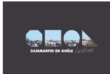
Dammartin-en-Goële, Variations, édité par le CAUE de Seine-et-Marne.

loppe également le dynamisme associatif dont fait preuve la ville, et qui complète le cadre de vie de la ville.