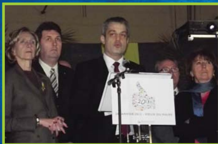
Retour sur la cérémonie des vœux du maire en page 3.