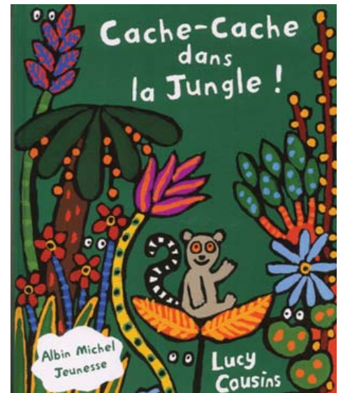
Cache-cache dans la jungle sur tapis narratifs, les 13 et 16 mars.

Enfin, la conteuse Aurélie Loiseau réglera l'imagination de son jeune public, avec son spectacle Trésors surprise le samedi 30, à 10h. Pour tous les publics, la journée du samedi 23 mars sera entièrement dédiée au Printemps des poètes, avec plusieurs animations autour de la poésie.